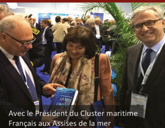
Avec le Président du Cluster maritime Français aux Assises de la mer