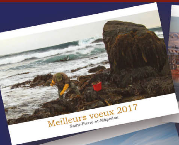
Meilleurs vœux 2017 Saint-Pierre-et-Miquelon

Chaque année, depuis 10 ans, la carte de vœux du Député est illustrée d'une photo ou d'une peinture d'un artiste de l'Archipel.