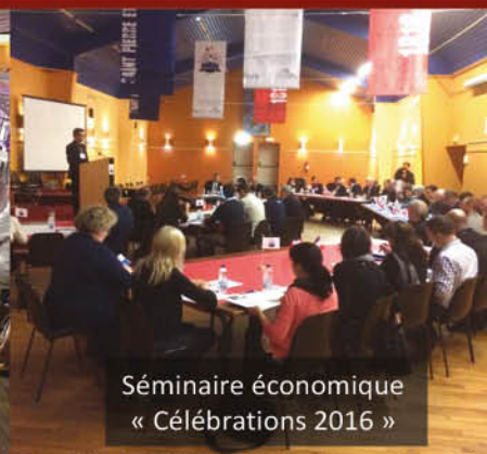
Séminaire économique « Célébrations 2016 »