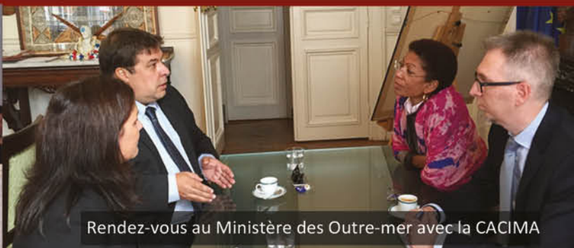
Rendez-vous au Ministère des Outre-mer avec la CACIMA