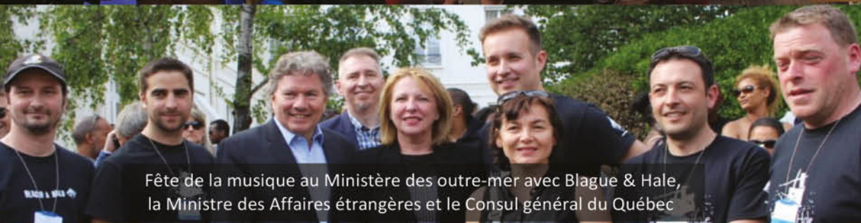
Fête de la musique au Ministère des outre-mer avec Blague & Hale, la Ministre des Affaires étrangères et le Consul général du Québec