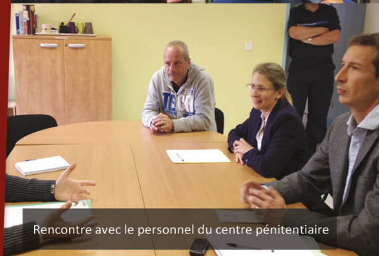
Rencontre avec le personnel du centre pénitentiaire