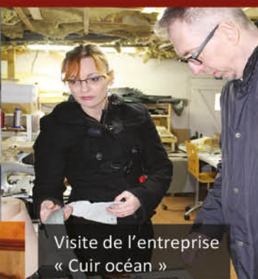
Visite de l'entreprise « Cuir océan »