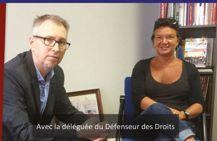
Avec la déléguée du Défenseur des Droits