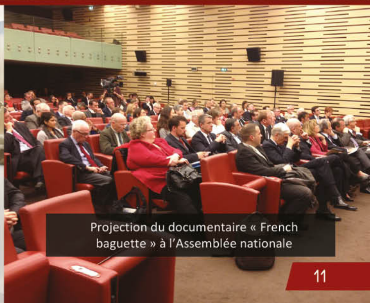
Projection du documentaire « French baguette » à l'Assemblée nationale