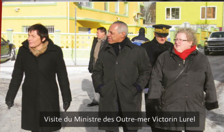
Visite du Ministre des Outre-mer Victorin Lurel