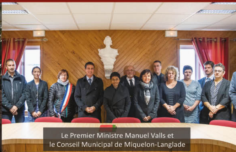
Le Premier Ministre Manuel Valls et le Conseil Municipal de Miquelon-Longlade