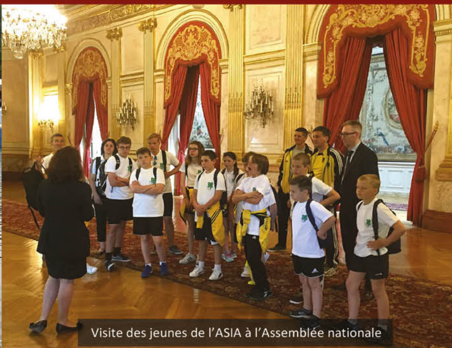
Visite des jeunes de l'ASIA à l'Assemblée nationale