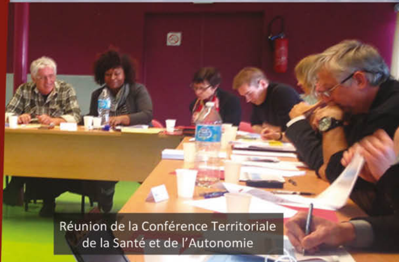
Réunion de la Conférence Territoriale de la Santé et de l'Autonomie