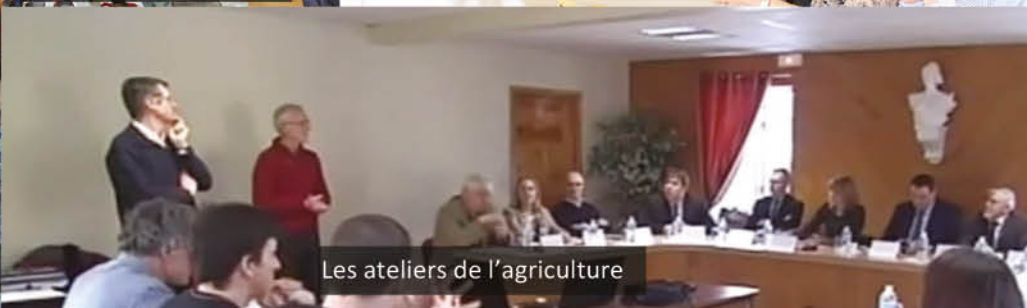
Les ateliers de l'agriculture