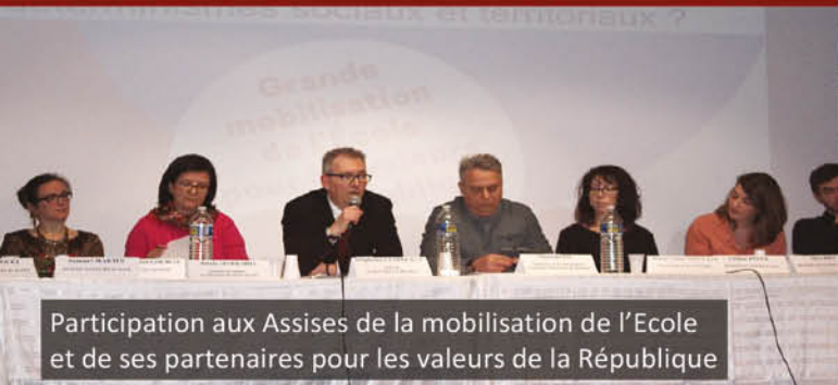
Participation aux Assises de la mobilisation de l'École et de ses partenaires pour les valeurs de la République