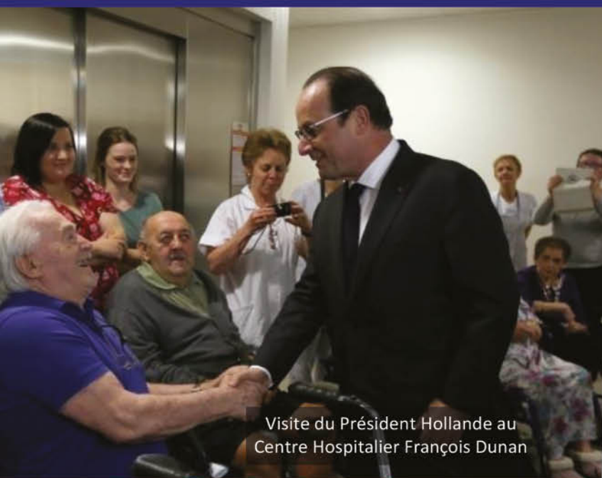
Visite du Président Hollande au Centre Hospitalier François Dunan