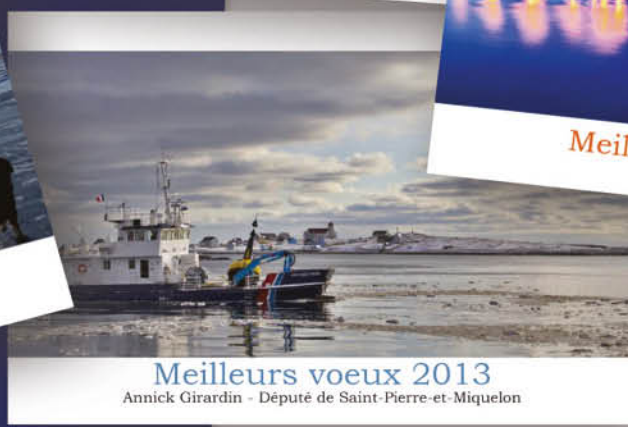
Meilleurs vœux 2013 Annick Girardin - Député de Saint-Pierre-et-Miquelon