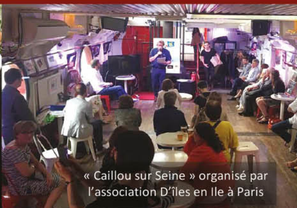
« Caillou sur Seine » organisé par l'association D'îles en Ile à Paris