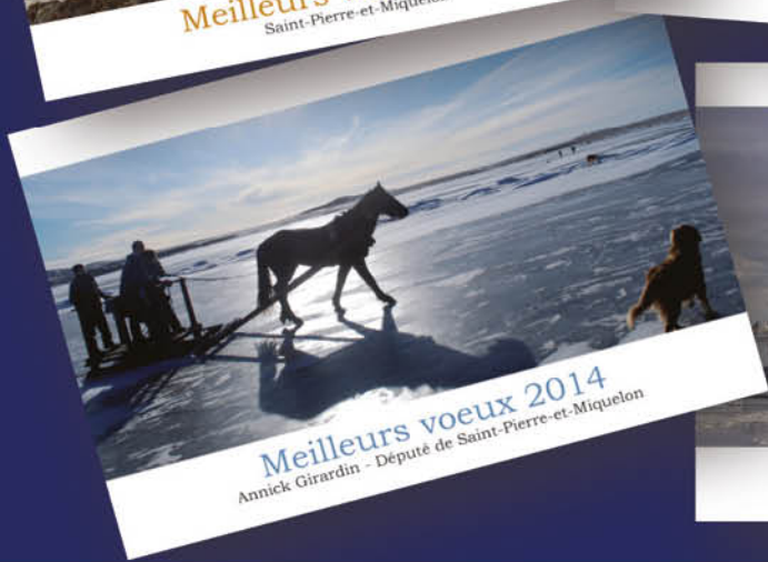
Meilleurs vœux 2014 Annick Girardin - Député de Saint-Pierre-et-Miquelon