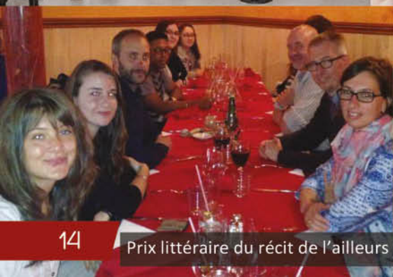
Prix littéraire du récit de l'ailleurs