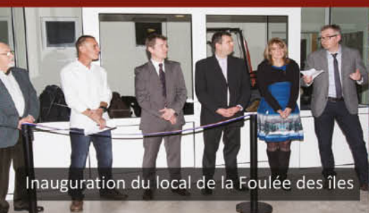
Inauguration du local de la Foulée des îles