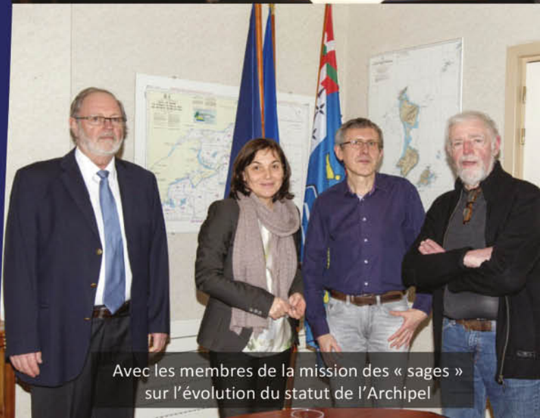
Avec les membres de la mission des « sages » sur l'évolution du statut de l'Archipel