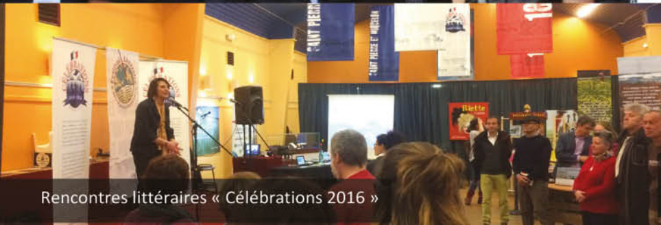
Rencontres littéraires « Célébrations 2016 »