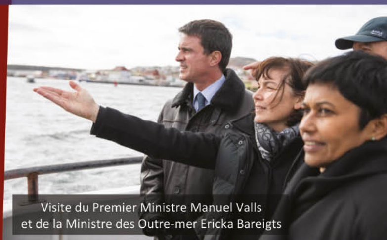
Visite du Premier Ministre Manuel Valls et de la Ministre des Outre-mer Ericka Bareigts