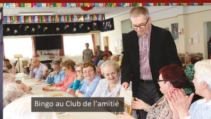
Bingo au Club de l'amitié