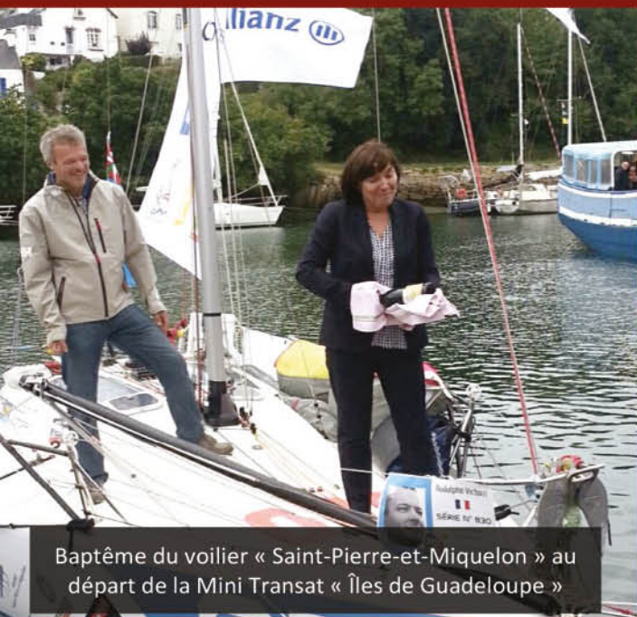
Baptême du voilier « Saint-Pierre-et-Miquelon » au départ de la Mini Transat « Îles de Guadeloupe »