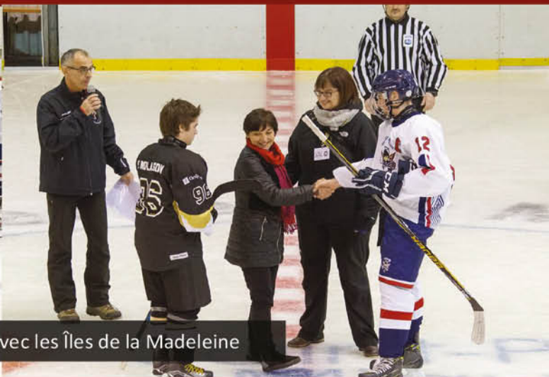
Tournoi francophone inter-îles avec les Îles de la Madeleine