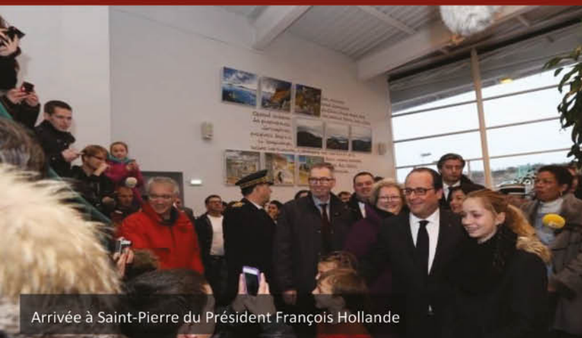
Arrivée à Saint-Pierre du Président François Hollande

Jamais Saint-Pierre et Miquelon n'aura suscité autant d'attention de la part de nos dirigeants que pendant le mandat qui s'achève. En cinq ans, le Président de la République François Hollande, le Premier ministre, Manuel Valls et 6 ministres auront honoré l'archipel de leur présence. Une première dans notre histoire, qui montre l'intérêt grandissant que suscite notre territoire au plus haut niveau de l'État.